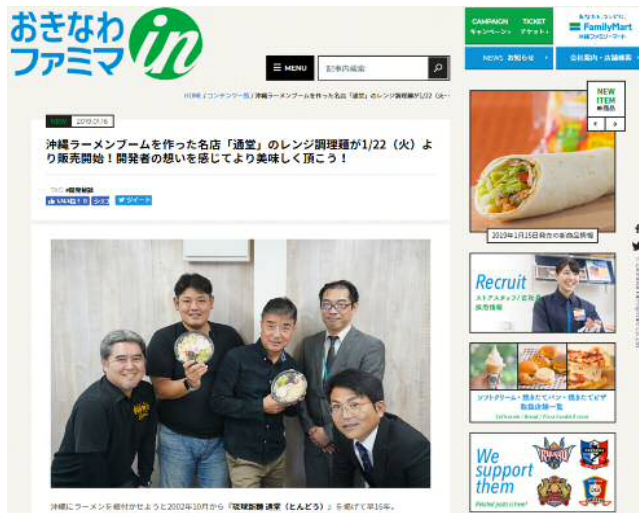
インタビューページ