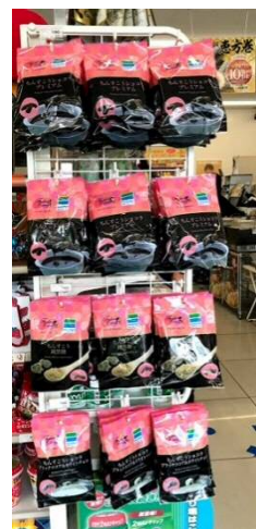
サイドネット什器展開イメージ

(一部店舗は除く。)小袋タイプのお菓子は、食べきりサイズの大きさや持ち運びに便利などの点から、20代~40代の女性のお客さまを中心に近年市場が伸長しております。